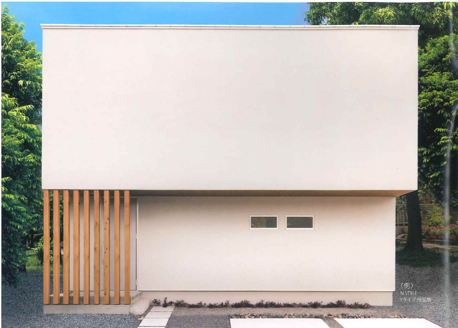
〈例〉 NSTYLE Lタイプ-陸屋根